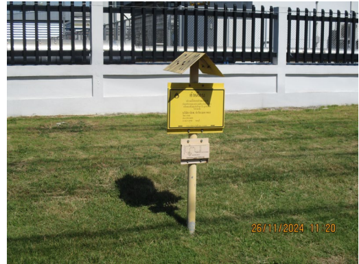
ภาพที่ 2-1 ป้ายแสดงตำแหน่งแนวท่อส่งก๊าซธรรมชาติ