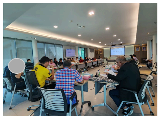
ภาพที่ 2-3 การประชาสัมพันธ์เรื่องการระงับเหตุฉุกเฉิน