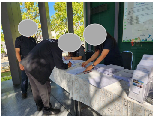
ภาพที่ 2-2 ศูนย์รับเรื่องร้องเรียน