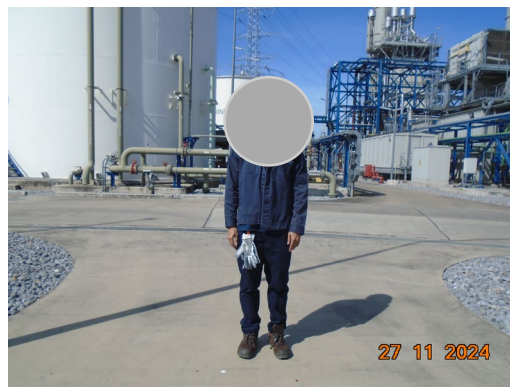
ภาพที่ 2-8 พนักงานสวมใส่อุปกรณ์คุ้มครองความปลอดภัยส่วนบุคคล