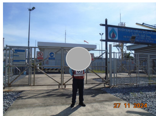
ภาพที่ 2-7 เจ้าหน้าที่รักษาความปลอดภัย บริเวณสถานีควบคุมความดันและวัดปริมาณก๊าซธรรมชาติ (MRS)