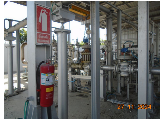
ภาพที่ 2-5 ถังดับเพลิงแบบผงเคมีแห้ง